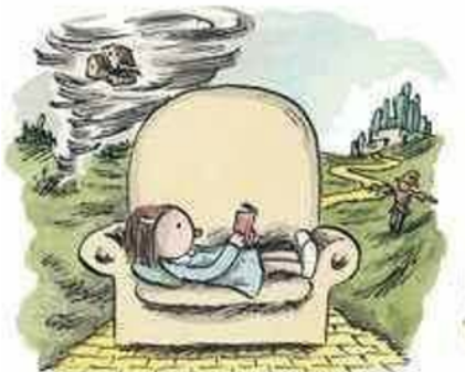
"El mago de Oz" L. Frank Baum

¿Ya viste cómo este camino amarillo es tan semejante al caminar de nuestro 11ºB?