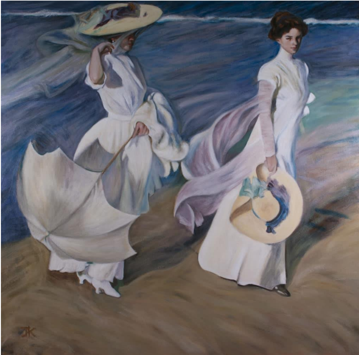
Joaquín Sorolla (1909) "Paseo a orillas del mar".