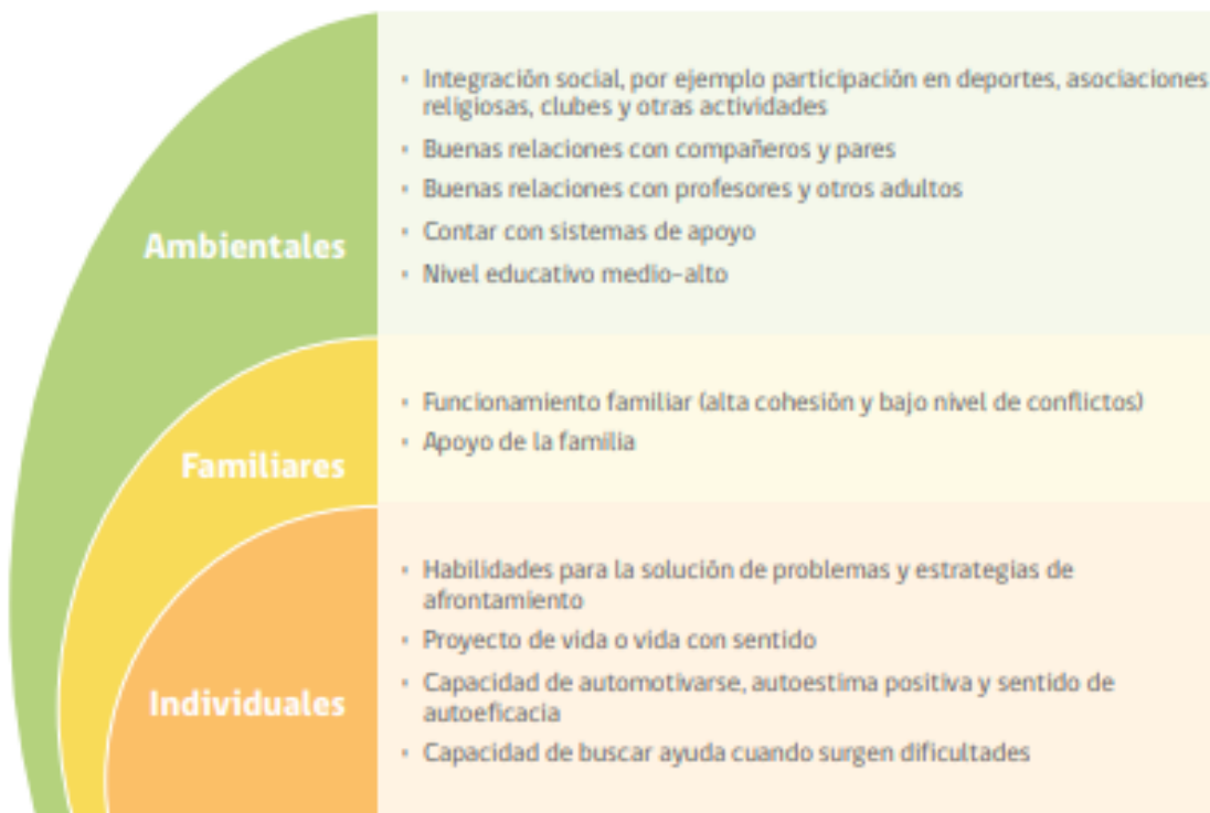
FIGURA 2. FACTORES PROTECTORES CONDUCTA SUICIDA EN LA ETAPA ESCOLAR