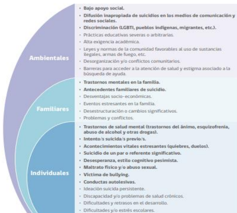
FIGURA 1. FACTORES DE RIESGO CONDUCTA SUICIDA EN LA ETAPA ESCOLAR