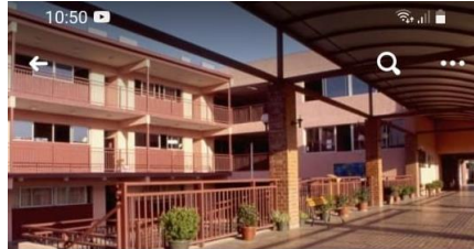
Ventas, ofertas, avisos comunidad San Carlos >