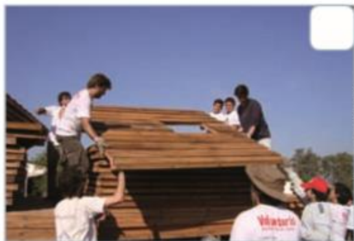
▶ Jóvenes voluntarios de Un Techo para Chile construyendo una mediagua.