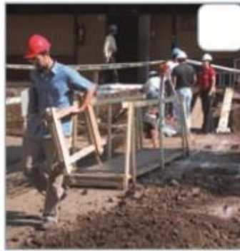
▶ Trabajadores y constructores reparando un colegio.