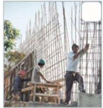
▶ Trabajadores construyendo un edificio en el centro de Santiago.