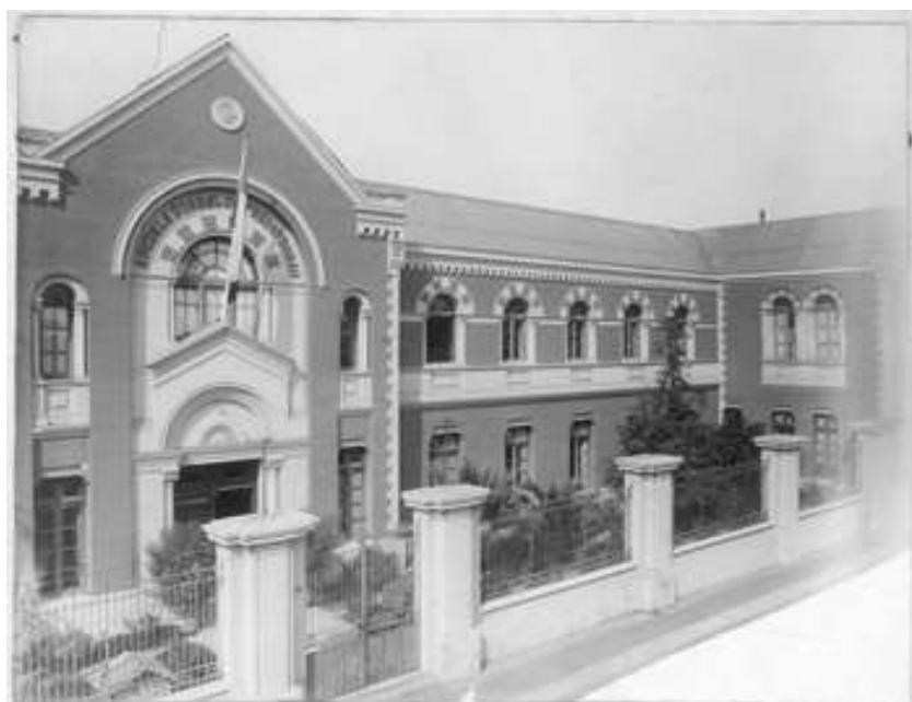
Edificio de la Escuela Normal de Preceptoras. Lugar donde Gabriela Mistral recibió el título de Maestra.

Gabriela Mistral, se destacó, no sólo por su poesía, sino que además fue una destacada Maestra Normalista, titulada de la Escuela Normal de Preceptoras de Chile, cuyo edificio se encontraba en el en el lugar donde actualmente funciona el Museo de la Educación Gabriela Mistral, llamado así en honor a su tan destacada personalidad.