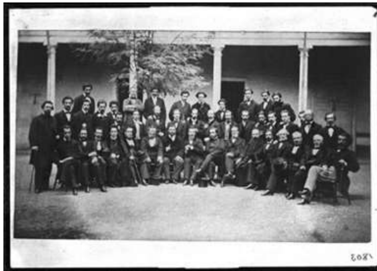
Profesores del Instituto Nacional 1880 Colección Museo Histórico Nacional

Sarmiento fue uno de los intelectuales latinoamericanos que más aportes hace a la educación chilena; su experiencia permitió elaborar manuales que se utilizaron en Chile y Argentina hasta principios del Siglo XX.