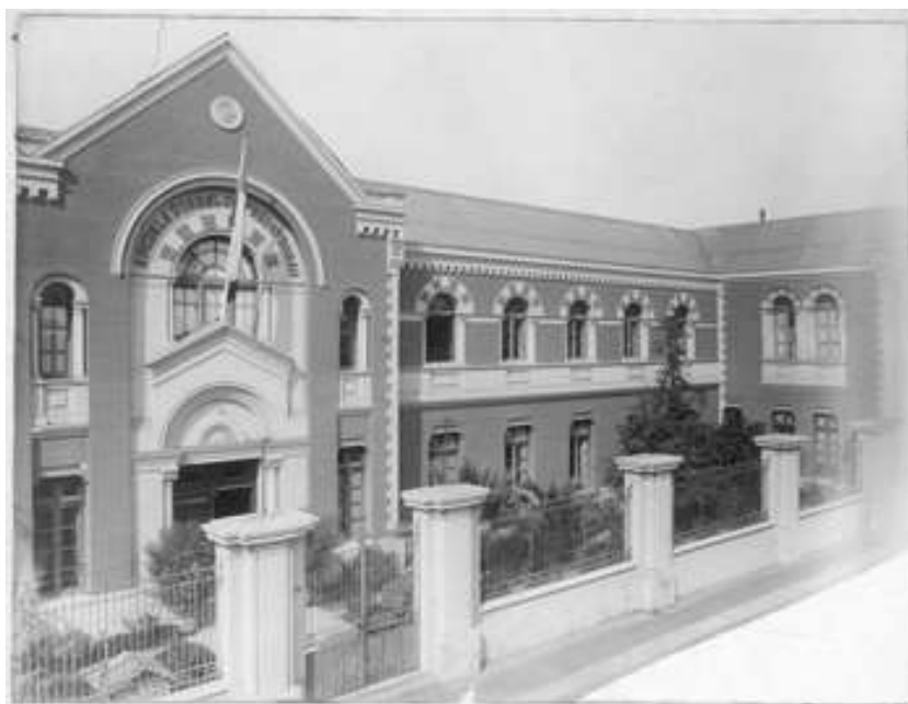
Edificio de la Escuela Normal de Preceptoras. Lugar donde Gabriela Mistral recibió el título de Maestra.

Gabriela Mistral, se destacó, no sólo por su poesía, sino que además fue una destacada Maestra Normalista, titulada de la Escuela Normal de Preceptoras de Chile, cuyo edificio se encontraba en el lugar donde actualmente funciona el Museo de la Educación Gabriela Mistral, llamado así en honor a su tan destacada personalidad.