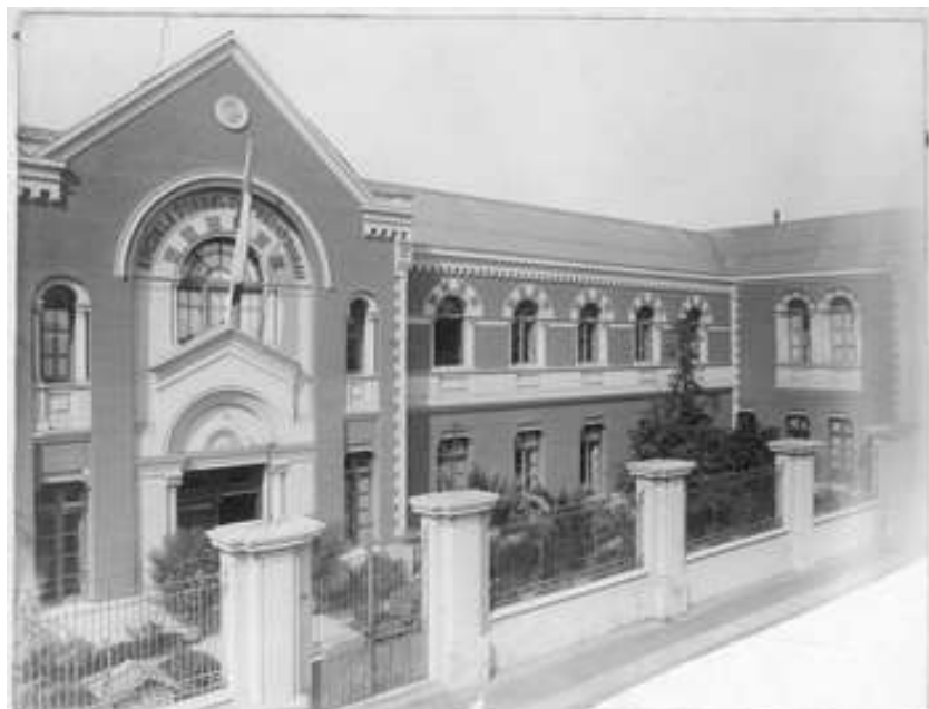
Edificio de la Escuela Normal de Preceptoras. Lugar donde Gabriela Mistral recibió el título de Maestra.

Gabriela Mistral, se destacó, no sólo por su poesía, sino que además fue una destacada Maestra Normalista, titulada de la Escuela Normal de Preceptoras de Chile, cuyo edificio se encontraba en el lugar donde actualmente funciona el Museo de la Educación Gabriela Mistral, llamado así en honor a su tan destacada personalidad.