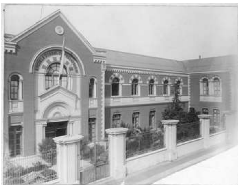
Edificio de la Escuela Normal de Preceptoras. Lugar donde Gabriela Mistral recibió el título de Maestra.

Gabriela Mistral, se destacó, no sólo por su poesía, sino que además fue una destacada Maestra Normalista, titulada de la Escuela Normal de Preceptoras de Chile, cuyo edificio se encontraba en el lugar donde actualmente funciona el Museo de la Educación Gabriela Mistral, llamado así en honor a su tan destacada personalidad.