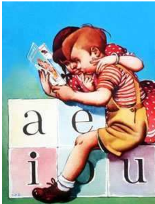
El Silabario Hispanoamericano, de Adrian Dufflocq Galdámez, Santiago 1953.

Este día conmemora la creación del Colegio de Profesores de Chile; pero la fijación de esta fecha no estuvo exenta de polémica, dado que fue impuesta por el régimen militar; y produjo gran rechazo en el gremio, dados los atropellos que existieron en contra de profesores y estudiantes durante este período.