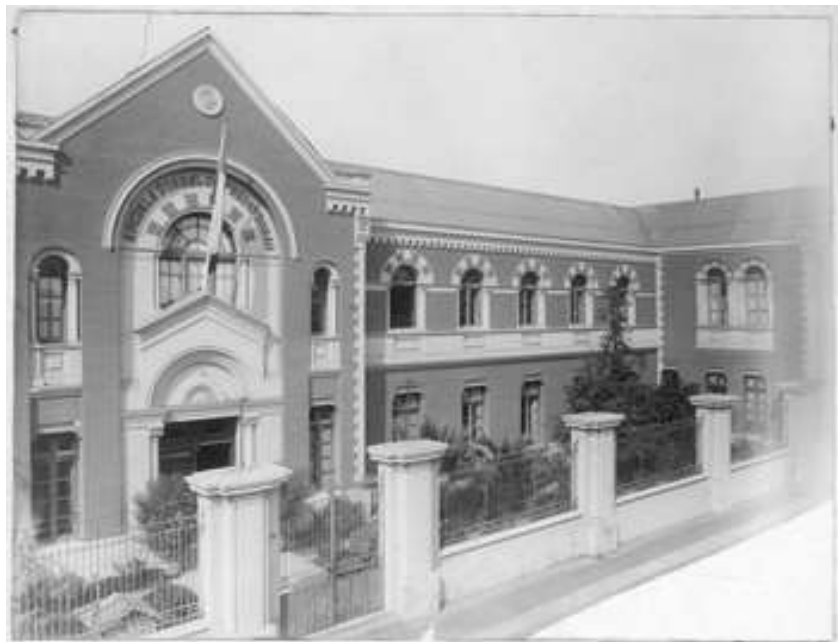
Edificio de la Escuela Normal de Preceptoras. Lugar donde Gabriela Mistral recibió el título de Maestra.

Gabriela Mistral, se destacó, no sólo por su poesía, sino que además fue una destacada Maestra Normalista, titulada de la Escuela Normal de Preceptoras de Chile, cuyo edificio se encontraba en el en el lugar donde actualmente funciona el Museo de la Educación Gabriela Mistral, llamado así en honor a su tan destacada personalidad.