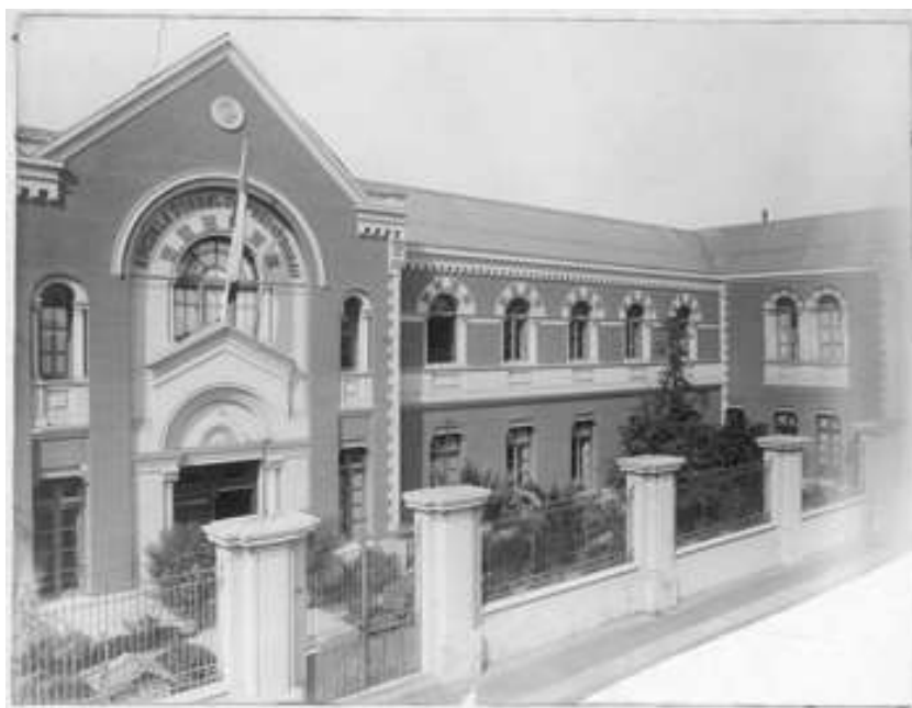
Edificio de la Escuela Normal de Preceptoras. Lugar donde Gabriela Mistral recibió el título de Maestra.

Gabriela Mistral, se destacó, no sólo por su poesía, sino que además fue una destacada Maestra Normalista, titulada de la Escuela Normal de Preceptoras de Chile, cuyo edificio se encontraba en el en el lugar donde actualmente funciona el Museo de la Educación Gabriela Mistral, llamado así en honor a su tan destacada personalidad.