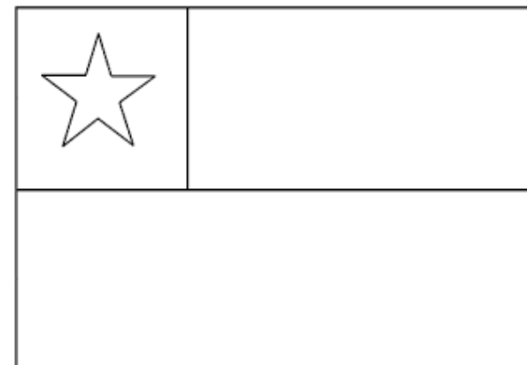
Bandera Chilena Actual