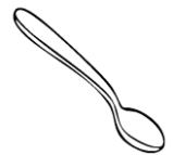
Cuchara de metal